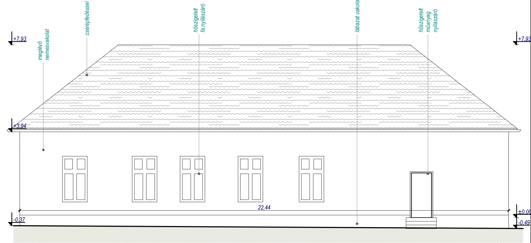
Felmérési vázlat nyugati homlokzat m=1:100

MEGJEGYZÉS: A meglévő szerkezetek nem kerültek feltárássra. Méretük és anyaguk feltételezésen alapul. A feltárt szerkezetek ismeretében az alkalmazott műszaki megoldásokat ellenőrizni kell! A méretek a helyszínen ellenőrizendő! Beépítés során a gyártó technológiai utasításait és a vonatkozó részletterveket be kell tartani! A konkrét termék kiválasztása során a tervezővel egyeztetni kell! A konkrét gyártmány, vagy típus megjelölése csak az építési termék elvárt műszaki teljesítményének egyértelmű meghatározása érdekében történt, ezekkel mindenben egyenértékű más gyártmány, vagy típus is megajánlható! A bontási munkák után a méretek ellenőrizendő!